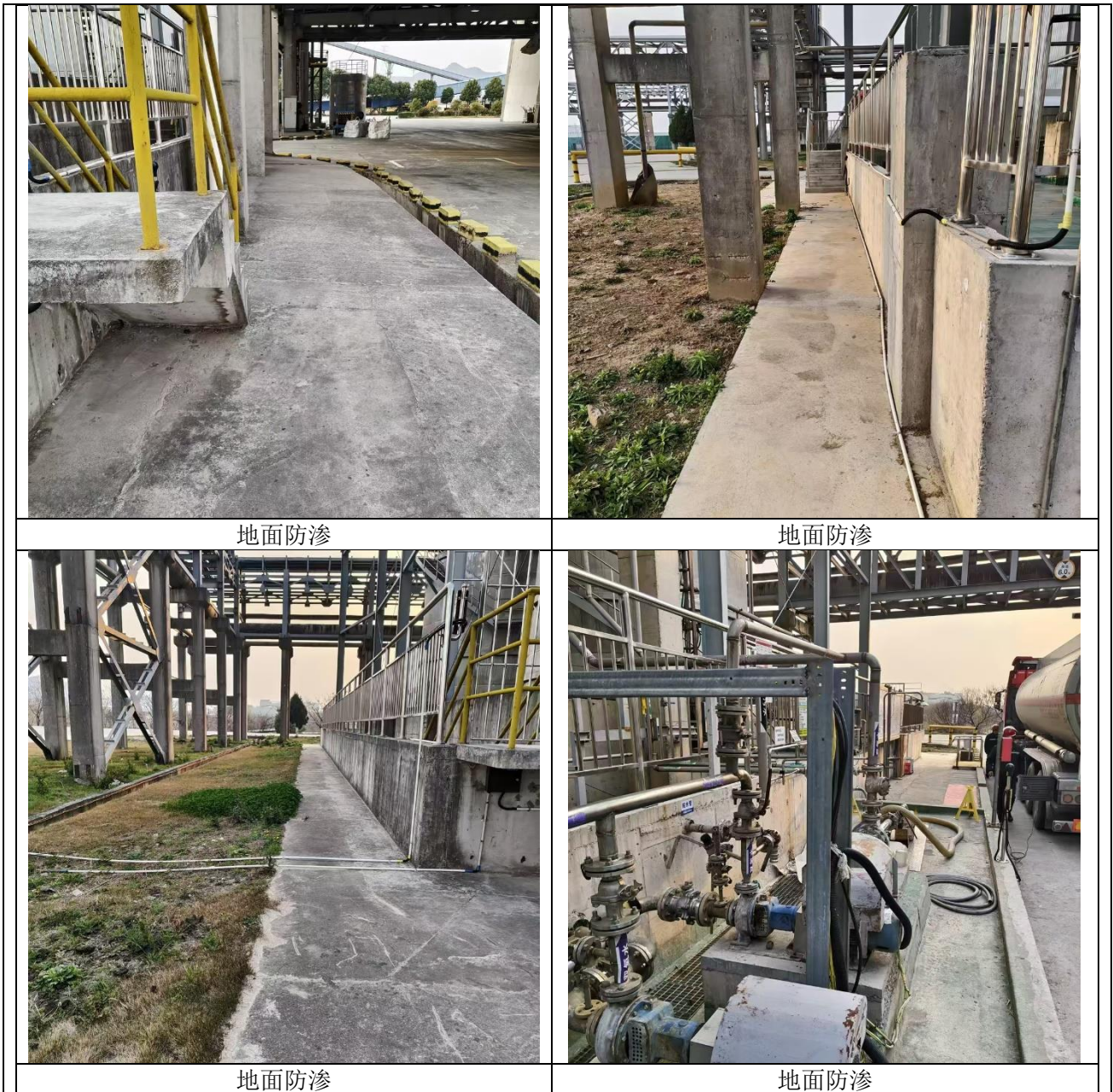
图 3-2 罐区风险防范设施