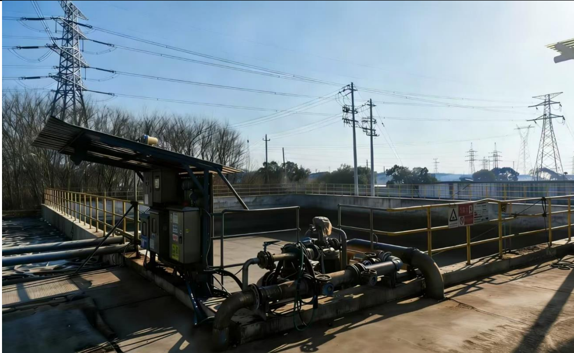
图 3-1 厂区事故应急池