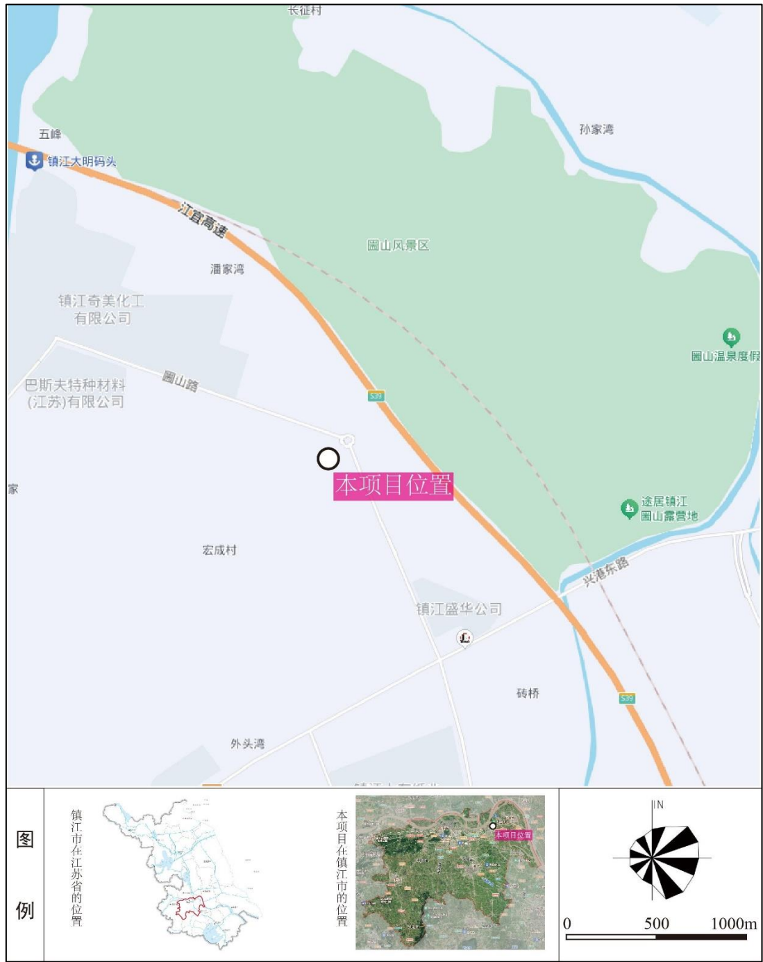
附图一 项目地理位置图